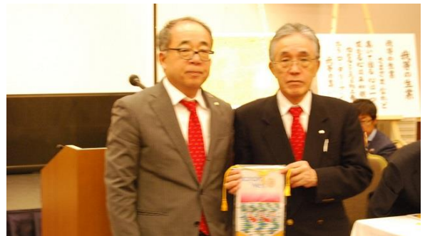
永井会長 ⇒ 千葉ガバナー補佐