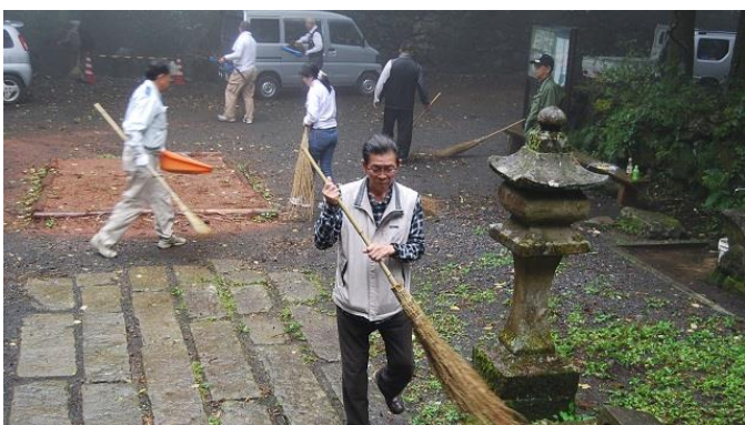
・会長のぶんまで頑張る副会長