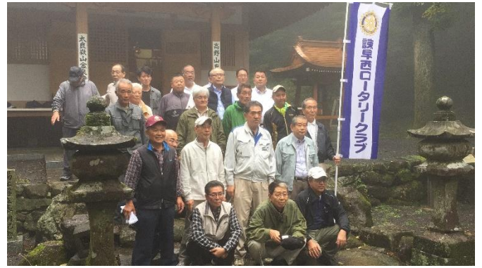
・例会出席点呼の集合写真