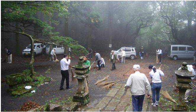
・到着次第清掃開始