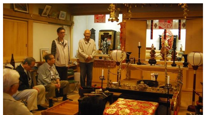
・金泉寺の再建苦労話