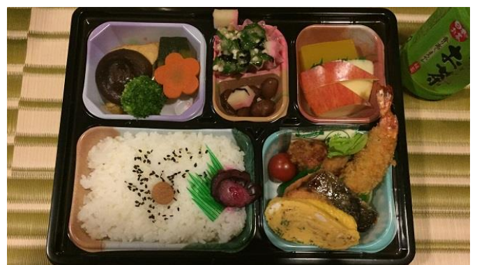
・100万ドルの豪華ランチ 幕の内弁当