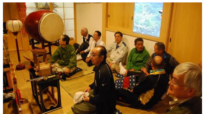
・じっと聞き入るメンバー