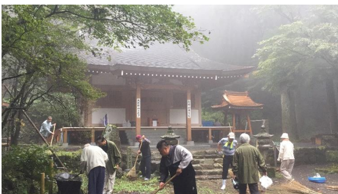
・霧雨にも負けず・・・標高が高いので雲の中