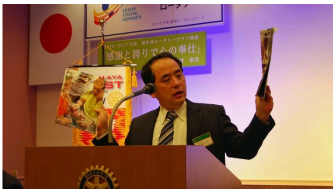
『ロータリーの友』11・12月号の読みどころ 川野委員