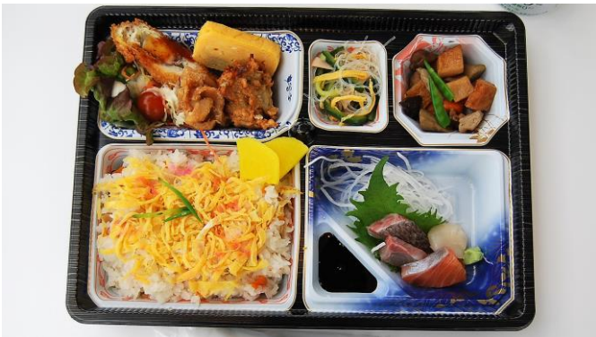
・本日のランチ（お弁当）