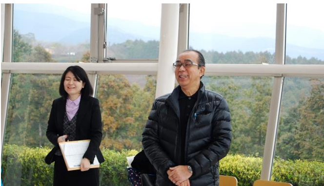
・森幹事の幹事報告